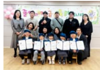
제32회 졸업식 및 진급식 (2/23)

상리자연친구들은 그동안의 성장과 노력을 돌아보며 졸업과 진급을 축하하는 뜻깊은 시간을 보냈습니다. 부모님을 포함해 모두의 응원을 받으며 자신감을 가지고 한 단계 더 성장하는 하루가 되었습니다.