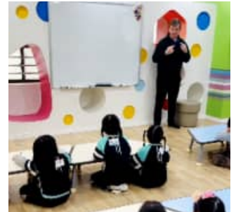
영어도서관 견학 (2/5)

공항 놀이를 해보았습니다. 보안검색대를 통과하고, 여권을 보여주며 비행기에 탑승하는 등 실제 공항처럼 다양한 상황을 체험해 보는 시간을 가졌습니다. 또한 기내식 체험과 면세점 체험까지 해보며 아이들은 흥미롭게 참여하고 즐거운 추억을 만들었습니다.