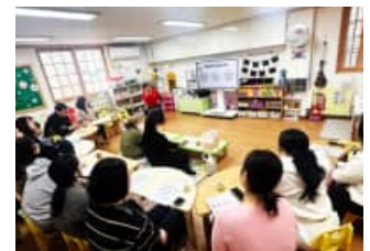
2026년도 입학식 (3/3)

각 반교실에서 오리엔테이션을 진행해 보았습니다. 어린이집 운영 방침과 프로그램을 안내해 드리고, 아이들의 생활과 발달에 대해 함께 이야기하며 소통하는 시간을 가졌습니다.