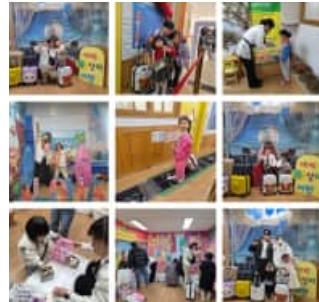
공항 놀이 (1/17)